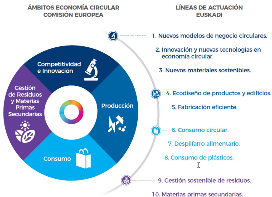
Imagen 2: ámbitos de actuación y líneas de actuación de la economía circular en Euskadi (Origen: Estrategia de Economía Circular de Euskadi 2030)